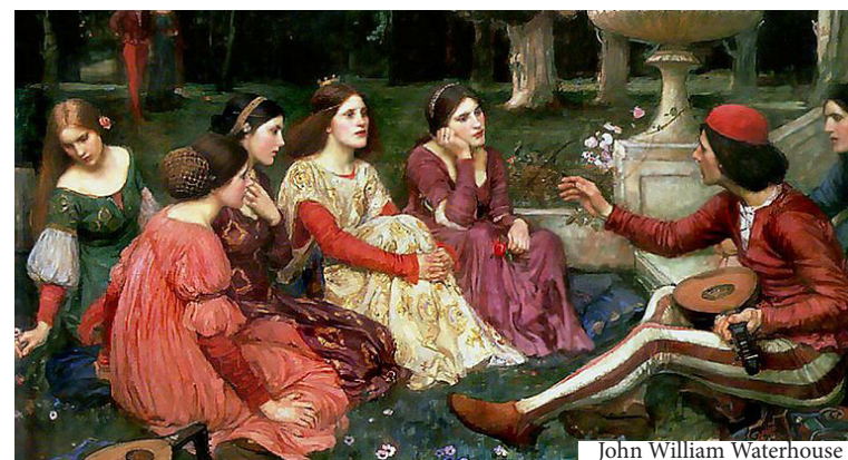
John William Waterhouse

Nous serons présents : Dimanche 27 sept.2020 de 10h à 18h30 au Festival des associations Vivacité au Parc Borély