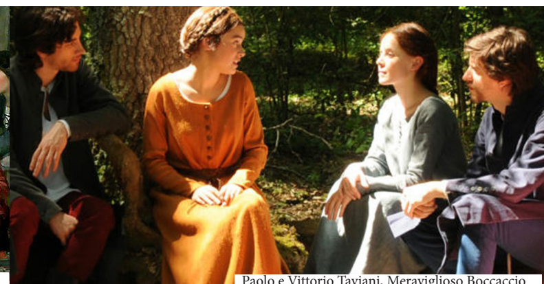
Paolo e Vittorio Taviani, Meraviglioso Boccaccio